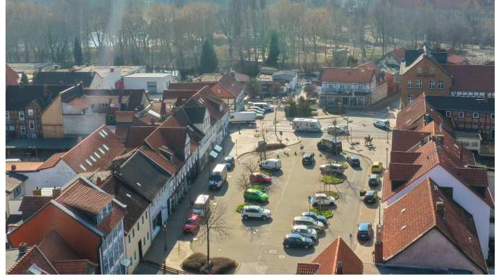
Wolfenbu#ttel Parkplatz Juliusmarkt-3.jpg