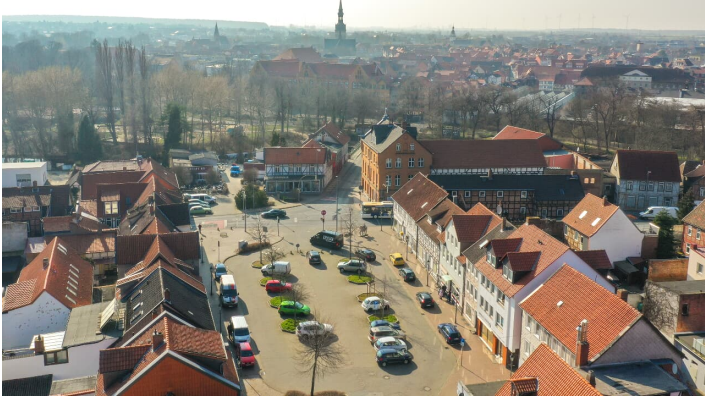
Wolfenbu#ttel Parkplatz Juliusmarkt-2.jpg