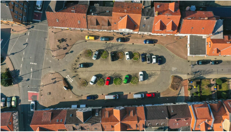
Wolfenbu#ttel Parkplatz Juliusmarkt-1.jpg