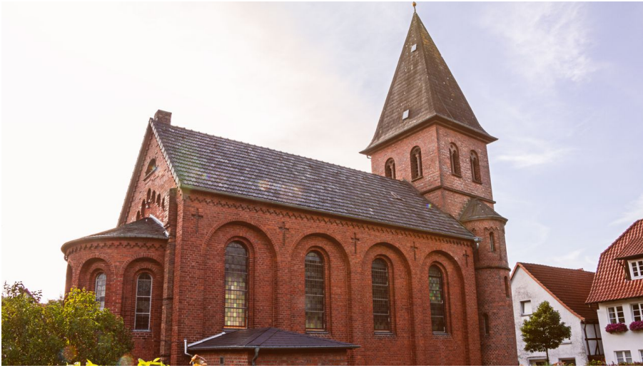
St.Johannis Kirche