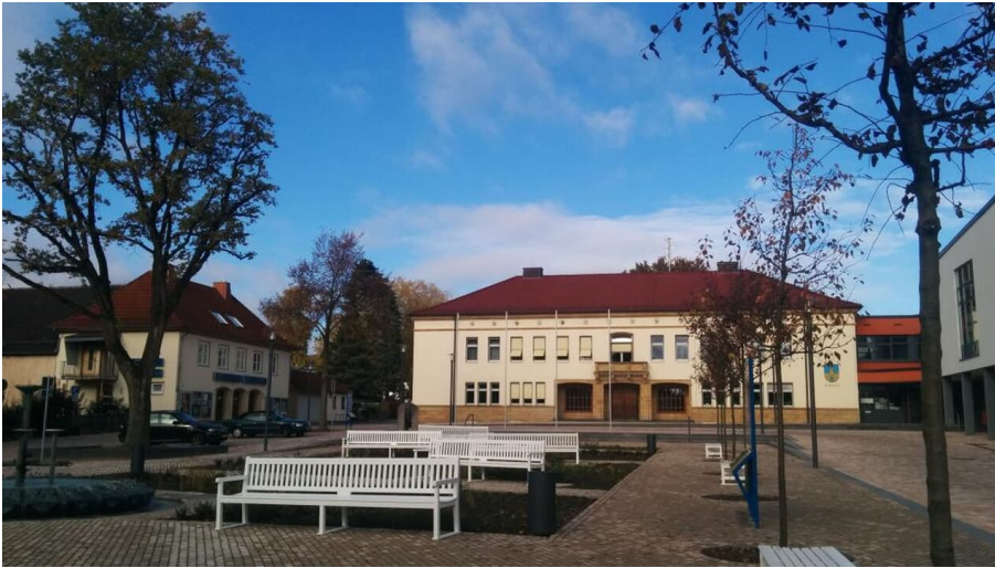
Rathaus Bad Driburg