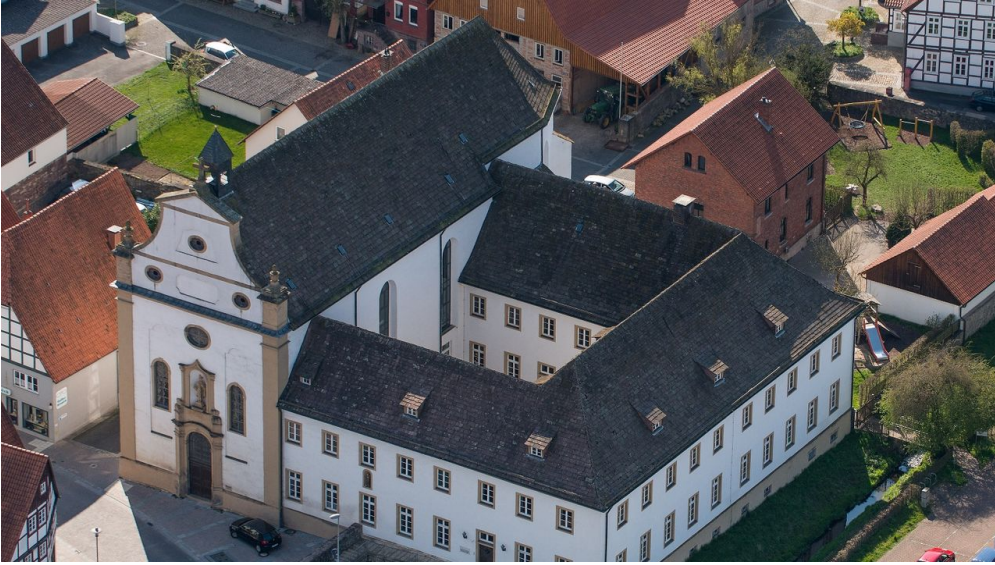
Luftaufnahme Franziskanerkloster in Lügde