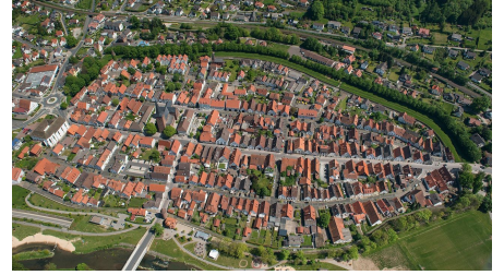
Luftaufnahme Lügder Altstadt - © Stefan Sieker, Stadt Lügde