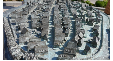
Stadmodell Lügde - © Stadt Lügde