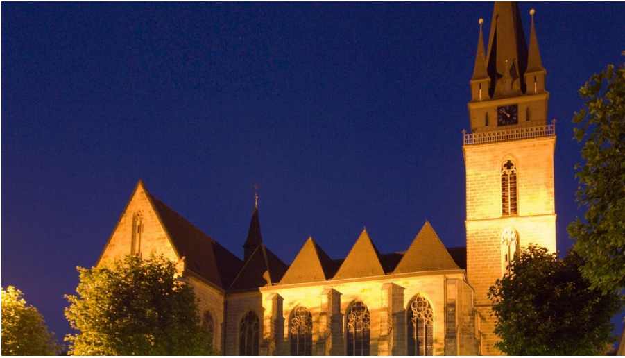
Pfarrkirche St. Peter und Paul bei Nacht