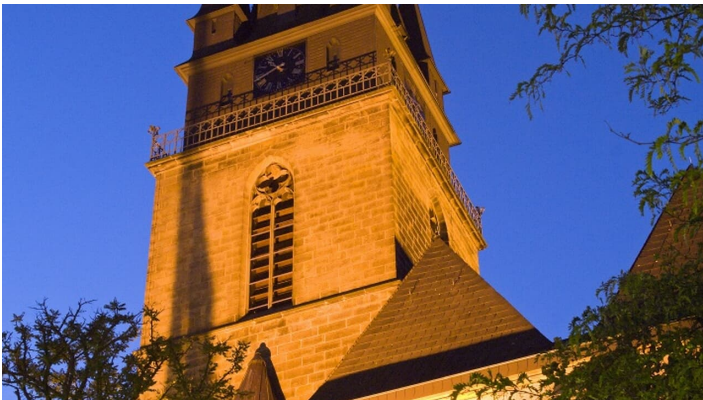
Pfarrkirche St. Peter und Paul bei Nacht