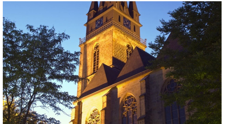
Pfarrkirche St. Peter und Paul bei Nacht