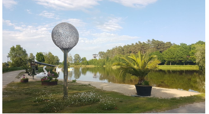
Obersee - © Gartenschaupark Rietberg GmbH