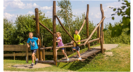
kinder-ettelsberg-brücke