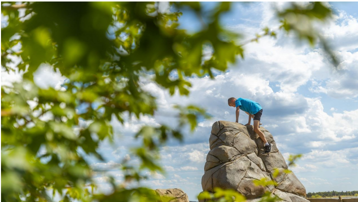
kind-kletterstein-ettelsberg c) david-heise-tourist-information-willingen.jpg