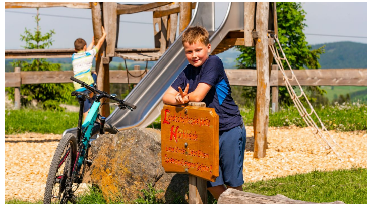
spielplatz-ettelsberg-schild.jpg - © DAVID HEISE, WWW.DAVIDHEISE.DE