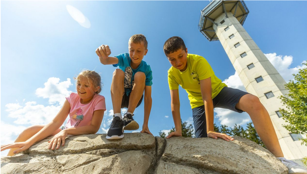
kinder-klettern-ettelsberg-hochheideturm.jpg