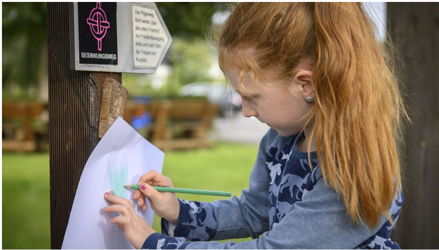
kinderpilgerweg c) klaus-peter-kappest-tourist-information-willingen.jpg