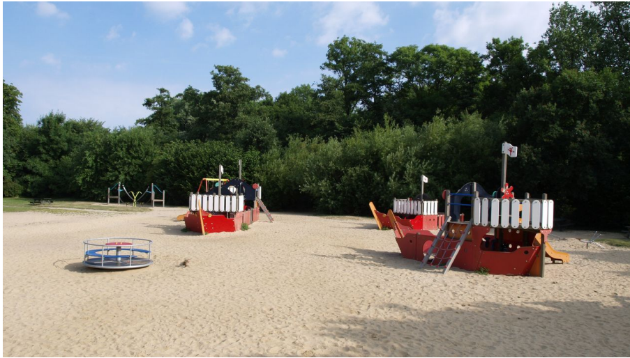
Spielplatz am Kurpark