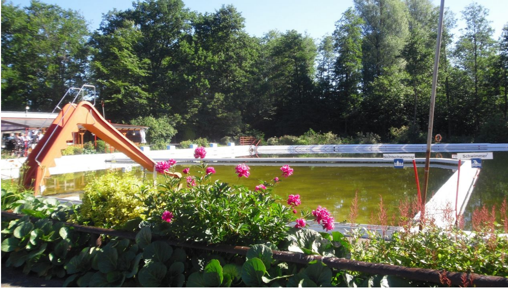
Quellenbad Bunsoh - © Silke Schernewski