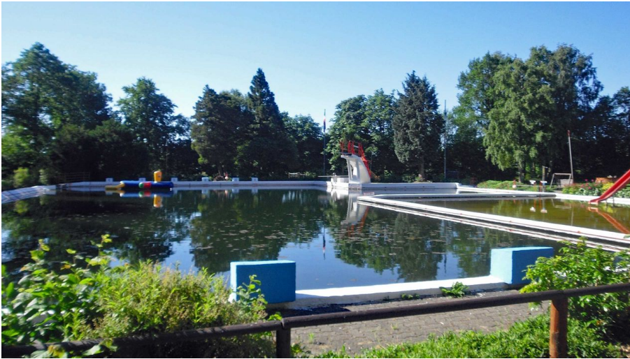
Quellenbad Bunsoh