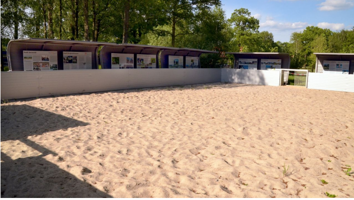
Beach-Soccer-Feld im Parkteil Nord