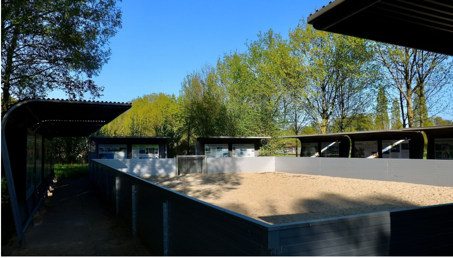
Beach-Soccer-Feld im Parkteil Nord