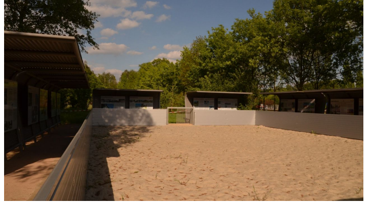
Beach-Soccer-Feld im Parkteil Nord - © Gartenschaupark Rietberg GmbH