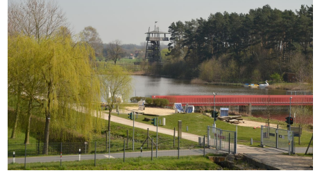
Blick vom Haupteingang auf den Aussichtsturm