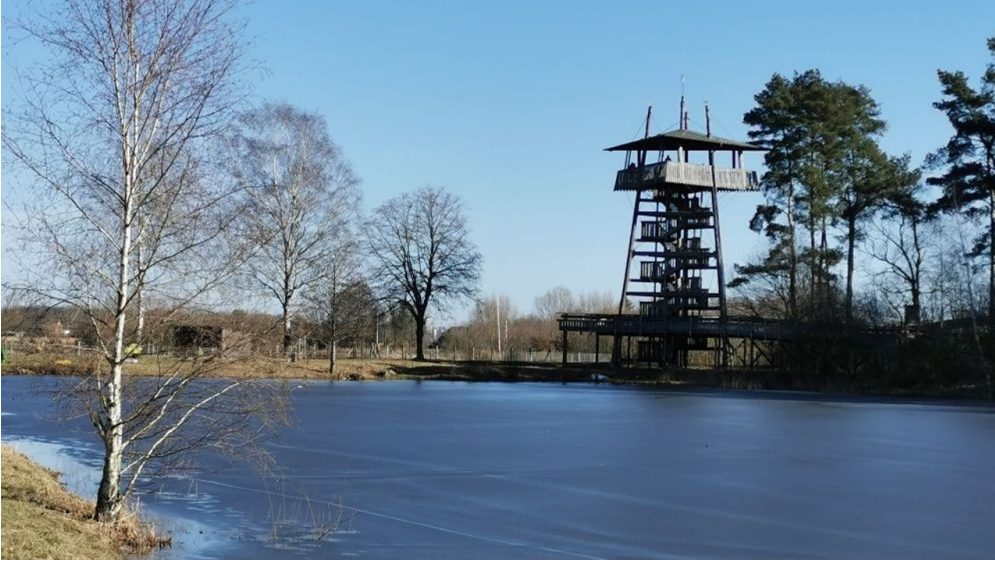
Aussichtsturm im Parkteil Mitte