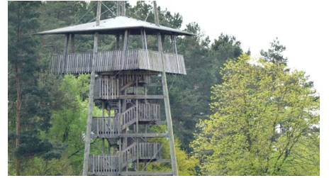
Aussichtsturm im Parkteil Mitte - © Gartenschaupark Rietberg GmbH