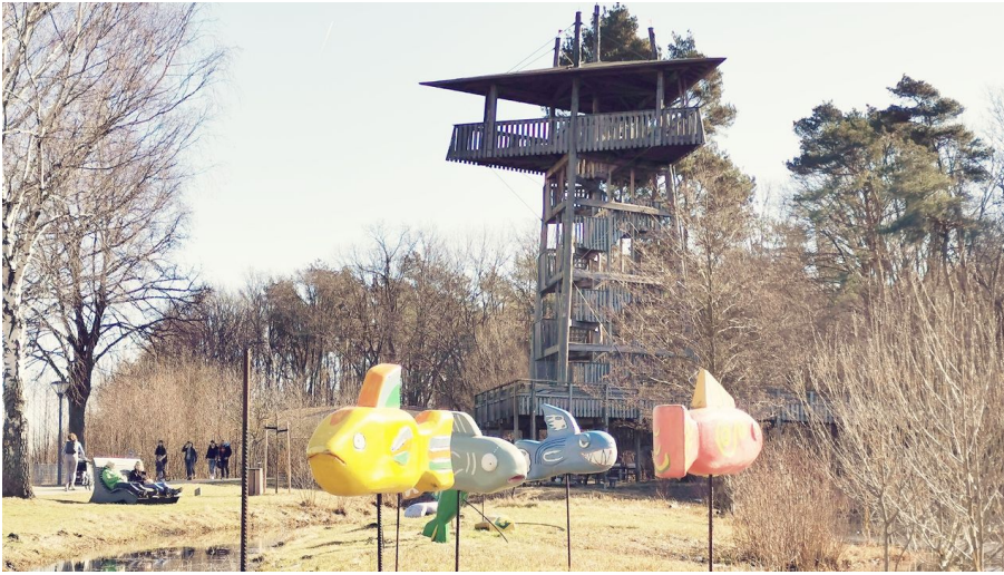
Blick auf den Aussichtsturm im Gartenschaupark Rietberg