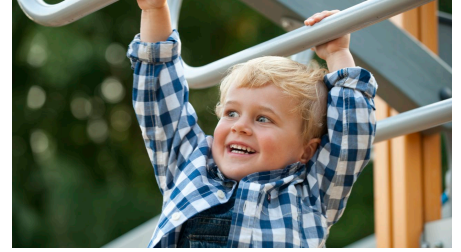
Spielplatz Freizeitanlage Nordseebad Otterndorf