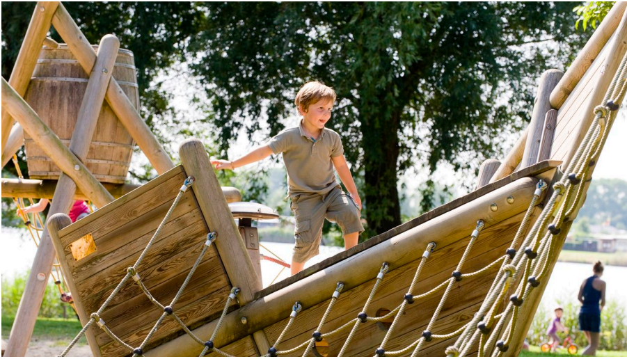
Freizeitanlage - Schiff