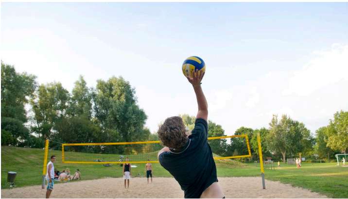
Spielplatz Freizeitanlage Nordseebad Otterndorf