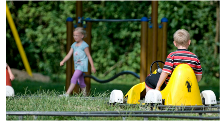
Spielplatz Freizeitanlage Nordseebad Otterndorf