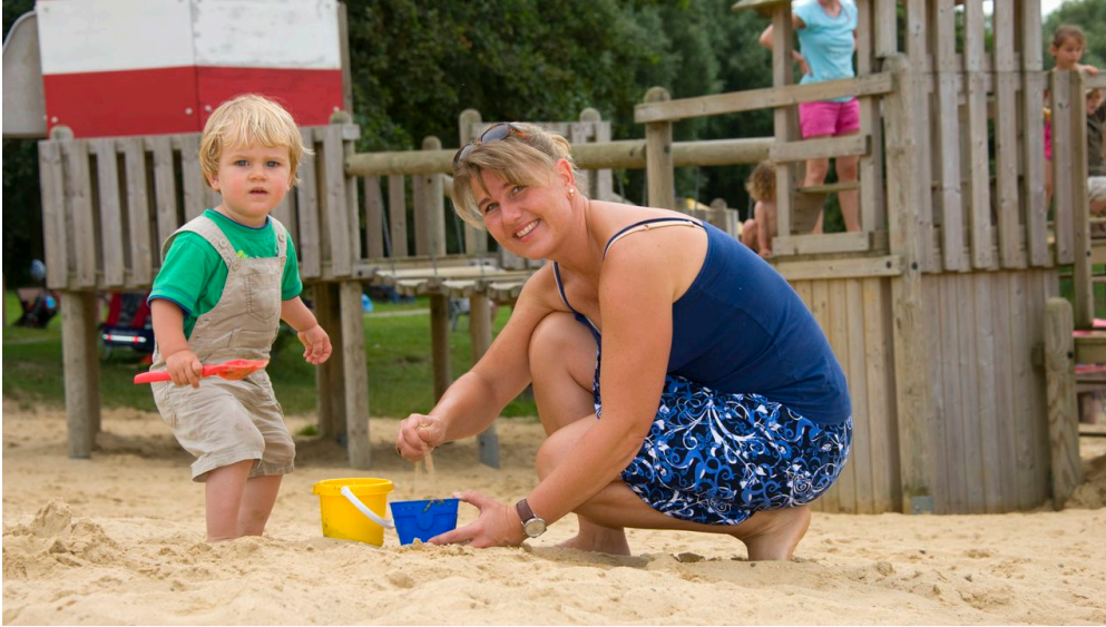
Spielplatz Freizeitanlage Nordseebad Otterndorf