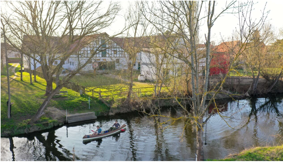
Kanusteg Halchter Wolfenbuettel.jpg