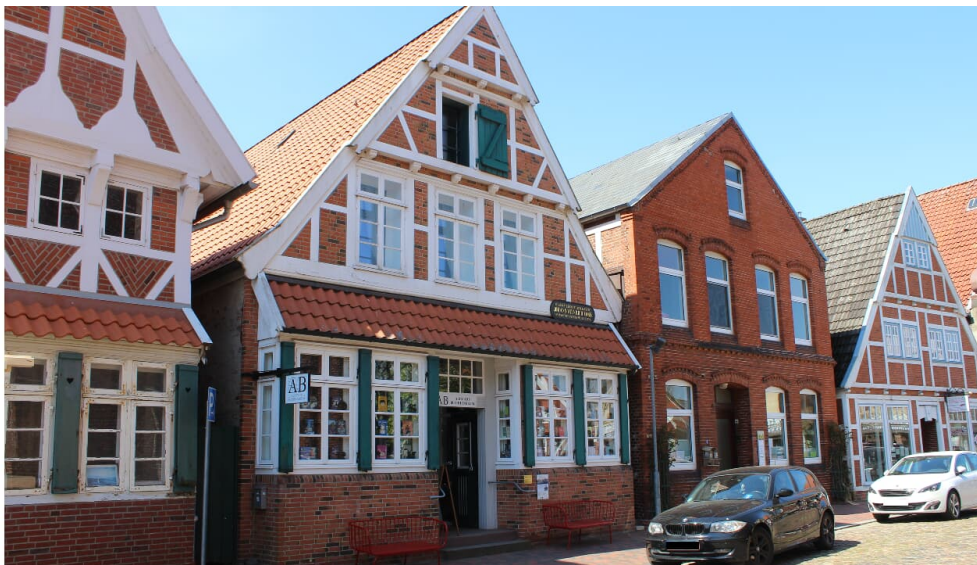
Otterndorf Altstadt Buchhandlung u. Johann Heinrich Voß Museum

Winterpause vom 1. November bis 24. Februar! Führungen sind auch abweichend von den regulären Öffnungszeiten (auch in den Wintermonaten) möglich.