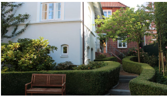
Garten Voß-Haus