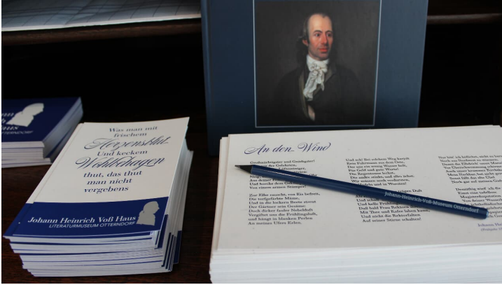
Museumsshop Voß-Haus