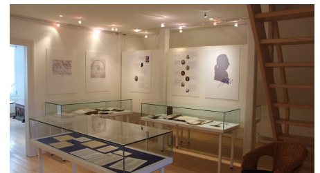
Johann Heinrich Voß Museum