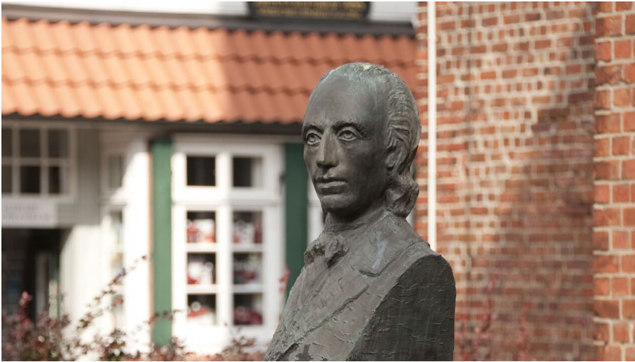
Voß Büste