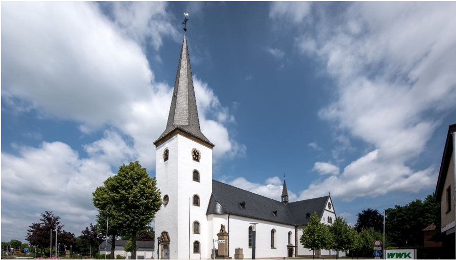
Pfarrkirche St. Maria Immaculata