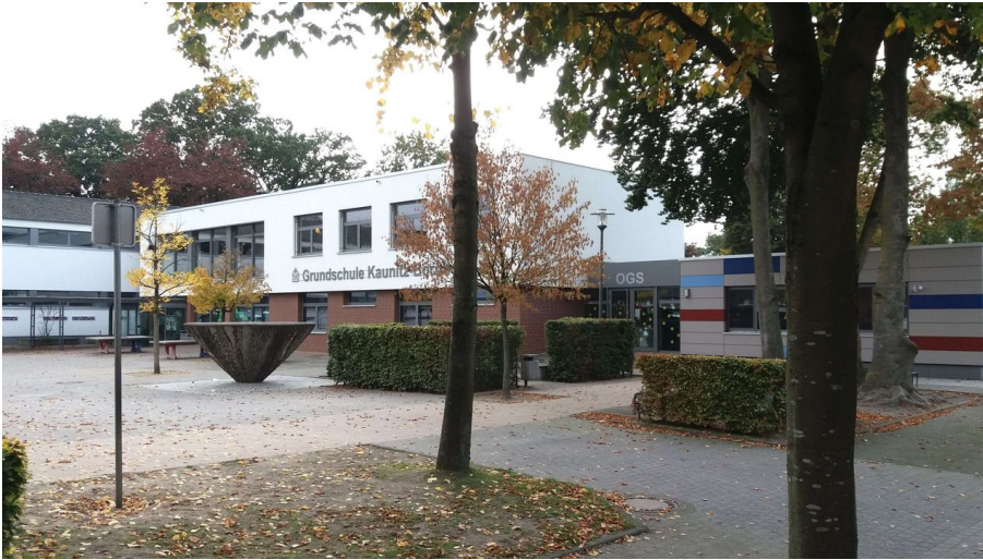
Schulhof der Grundschule Kaunitz-Bornholte