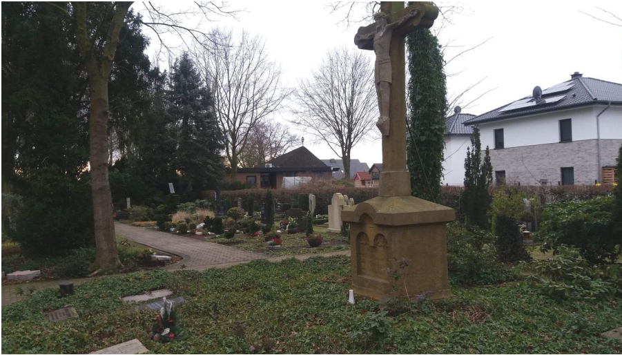
Hochkreuz auf dem Friedhof