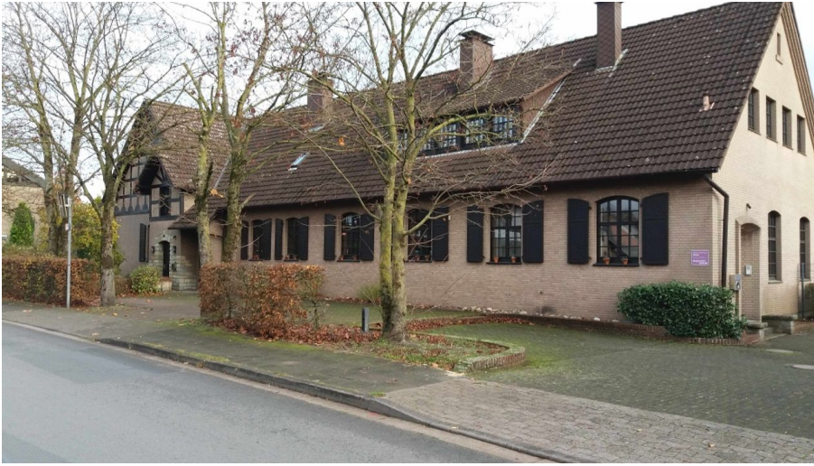
Feldschule Bornholte