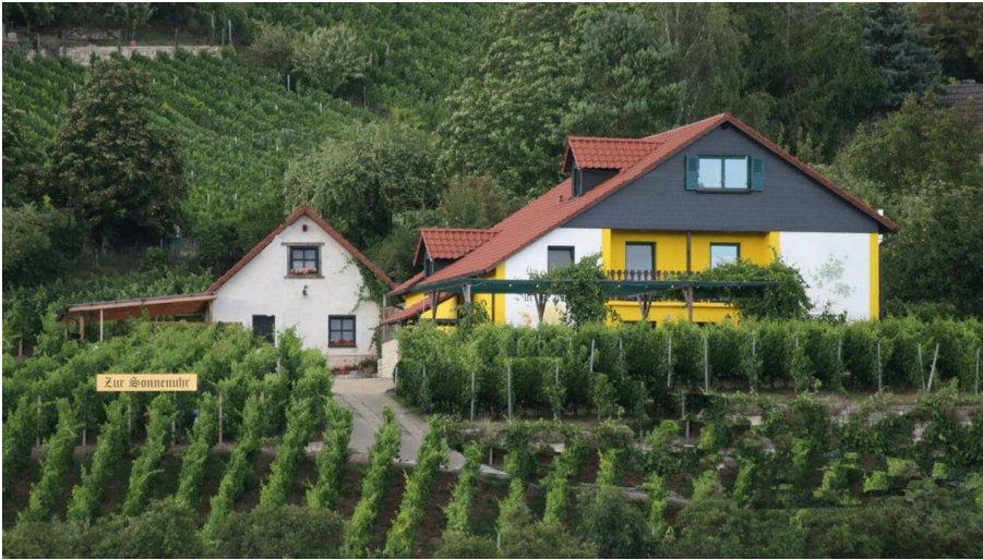
Weinhaus Zur Sonnenuhr.jpg