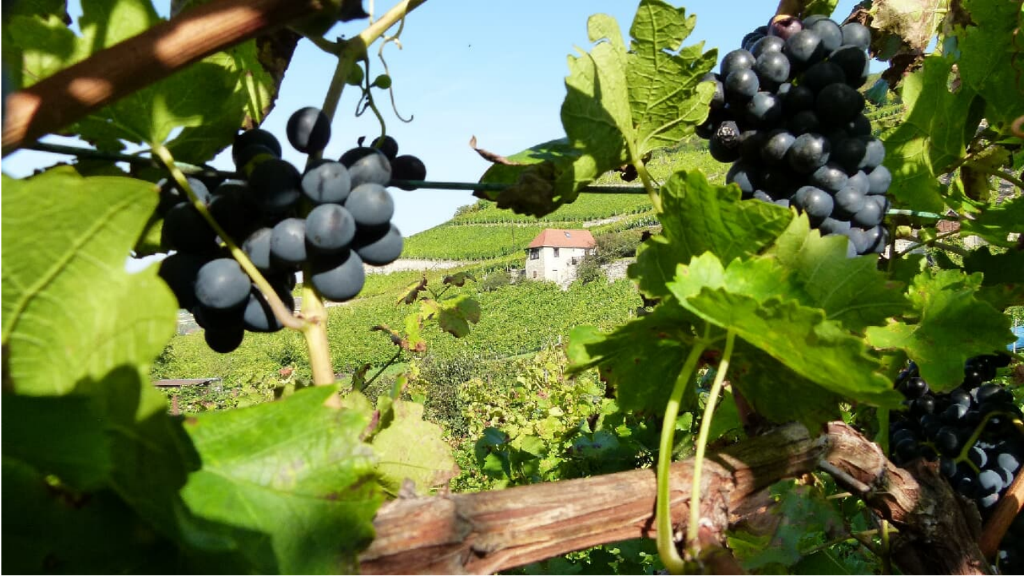
Freyburg Pension Unstrutpromenade Ansicht Weinhaus Zur Sonnenuhr.jpg