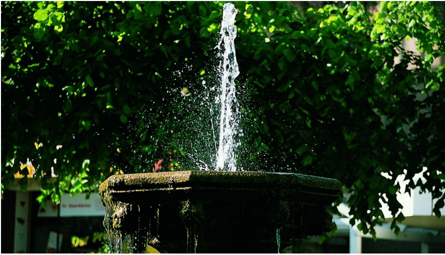
Der Kump auf dem Marktplatz in Steinheim