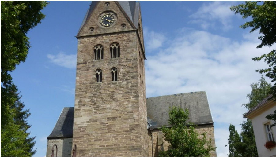
Kath. Kirche St. Marien