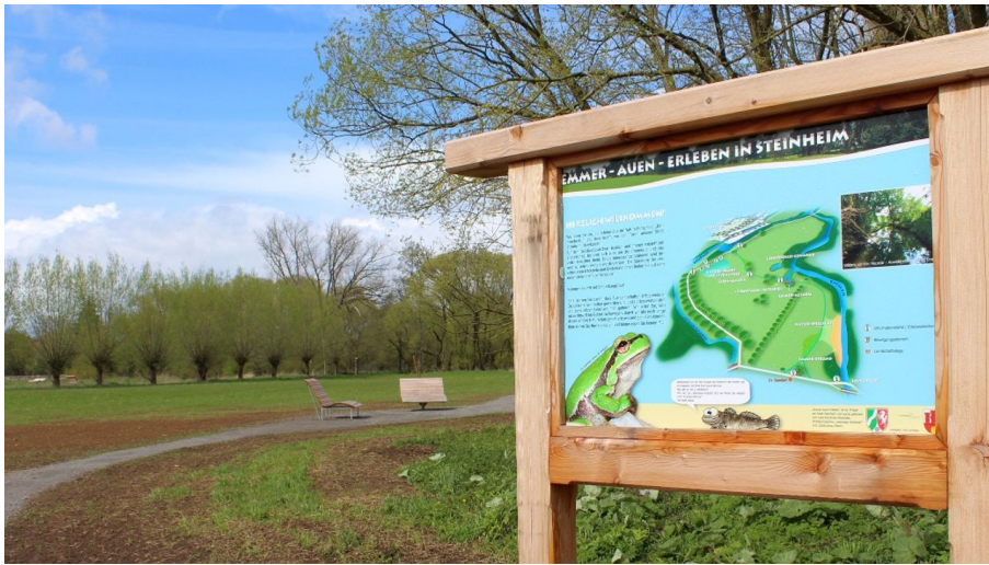
Infoschild Emmerauen Weg