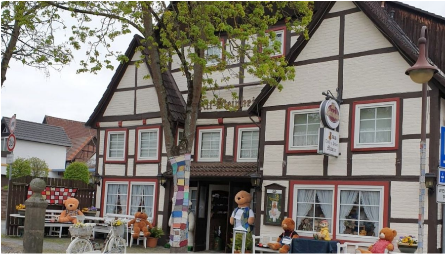
Teddy- und Puppenmuseum