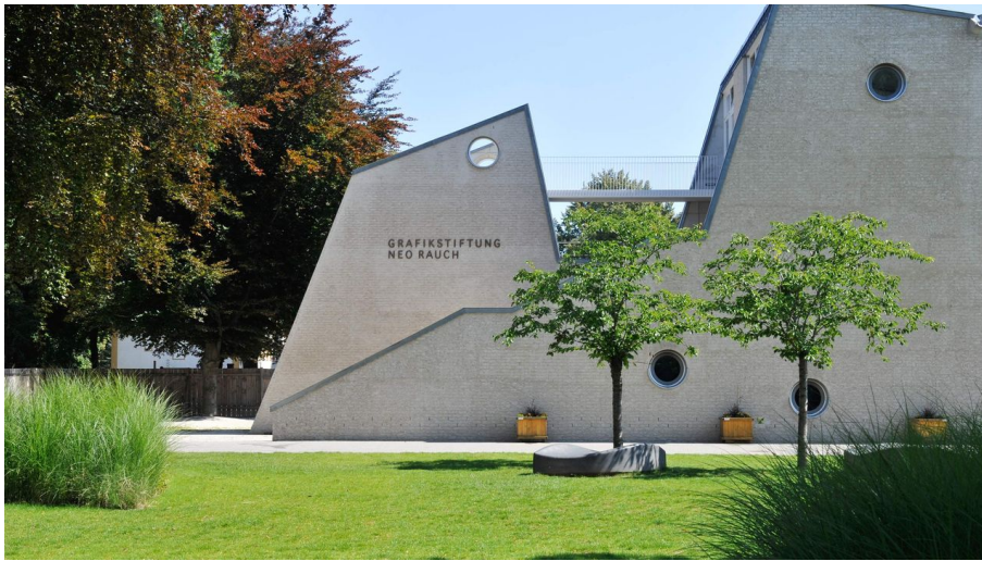
Grafikstiftung Neo Rauch in Aschersleben - Außenansicht