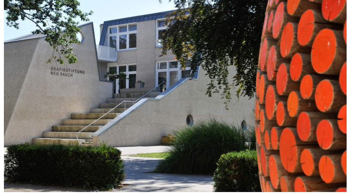
Grafikstiftung Neo Rauch in Aschersleben - Außenansicht