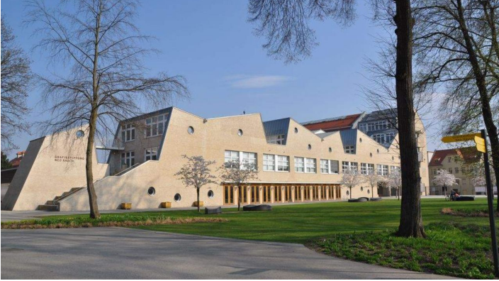
Grafikstiftung Neo Rauch in Aschersleben - Außenansicht