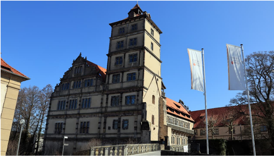
Schloss Brake_2021_03.jpg