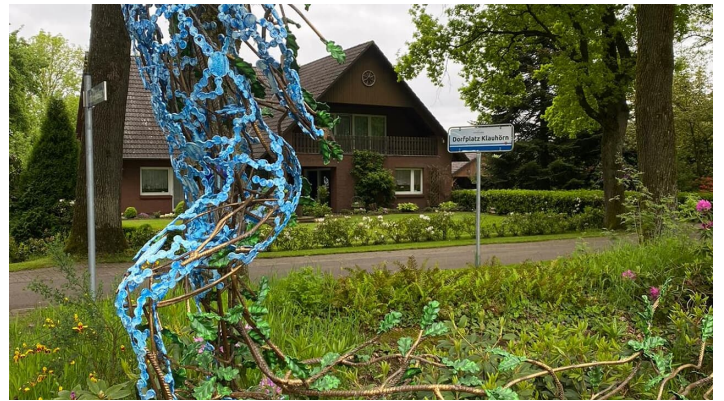
Eichenkönig mit Bank