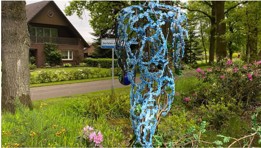
Lieblingsort Klauhörn - Eichenkönig