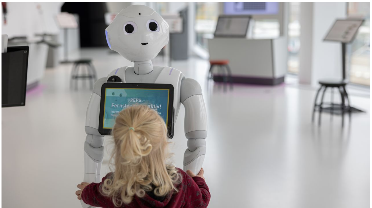
Blick in die phaeno Ausstellung

Dienstag bis Freitag: 9:00 bis 17:00 Uhr Samstag, Sonntag und Feiertage: 10:00 bis 18:00 Uhr Montags, 24.12. und Samstag, 31.12. geschlossen Öffnungszeiten in den niedersächsischen Schulferien: täglich: 10:00 bis 18:00 Uhr