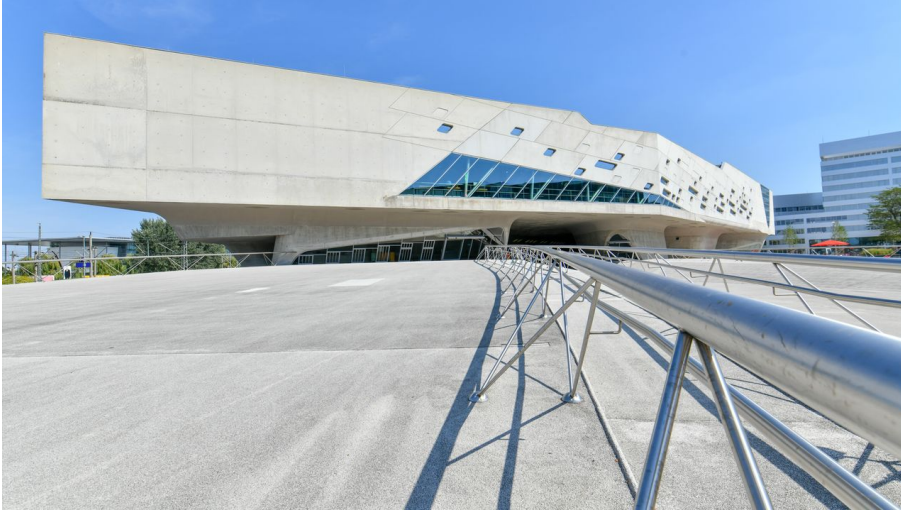
phaeno Außenansicht