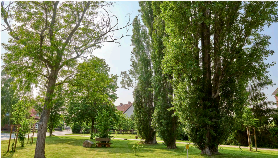
Rastplatz in Wetzleben