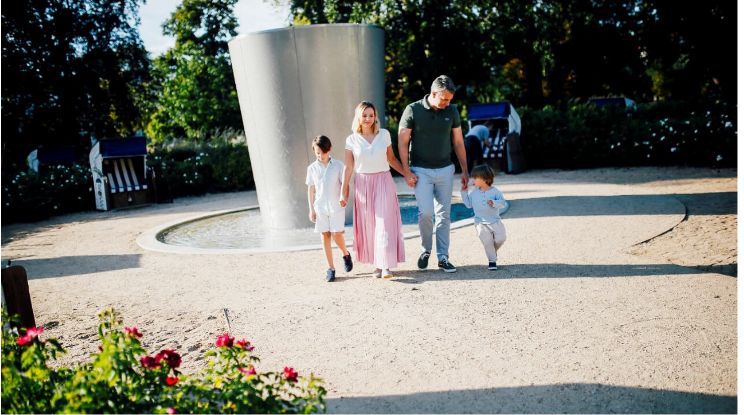
(c) Staatsbad Salzuflen GmbH_S Strothbäumer_Familie_Solestrand (1).jpg