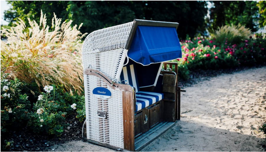
(c) Staatsbad Salzuflen GmbH_S Strothbäumer_Strandkorb_Solestrand (3).jpg - © S. Strothbäumer

Der Sole-Strand im neuen Erlebnis- und Gesundheitspark empfängt Sie mit bequemen Strandkörben, die zum Verweilen und Entspannen einladen.