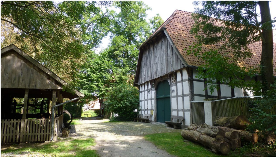
Das Holzhandwerksmuseum