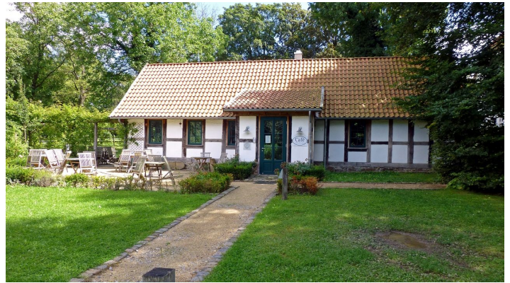
Café Alte Werkstatt - © Biologische Station Ravensberg im Kreis Herford e.V.