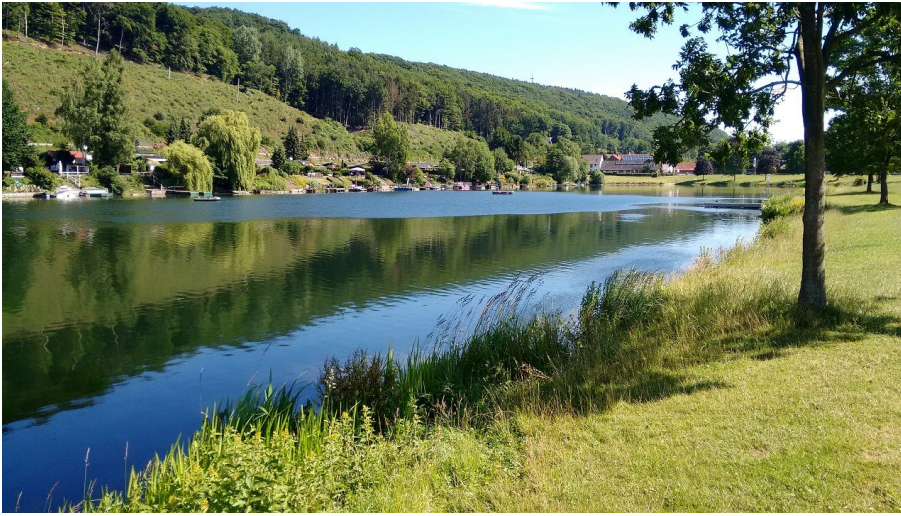
Freizeitpark Borlefzen