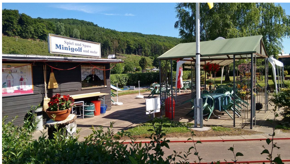
Freizeitpark Borlefzen