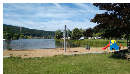
Freizeitpark Borlefzen