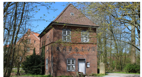
Nordseebad Otterndorf Torhaus