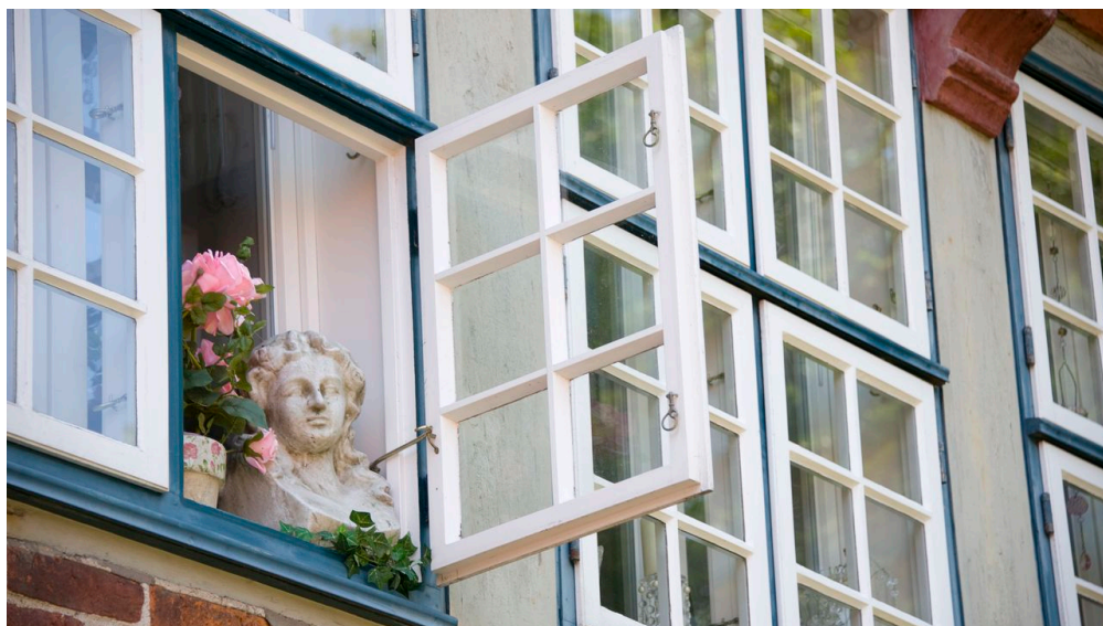
Nordseebad Otterndorf_Historische Altstadt_Lateinschule