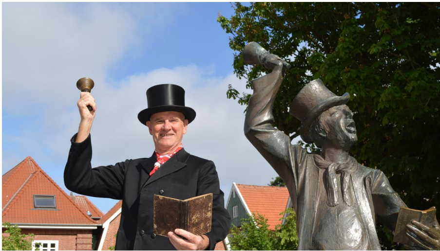
Der Utröper - als Bronze und in echt