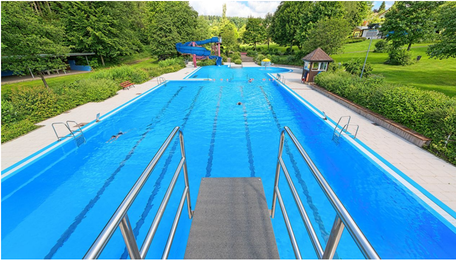
Freibad Loßburg Sprungturm