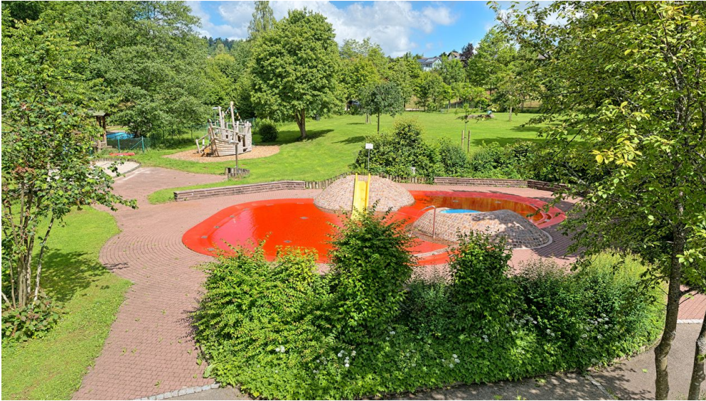
Freibad Lossburg Kinderbecken

Die Freibad-Saison beginnt am 25. Mai und endet am 08. September.