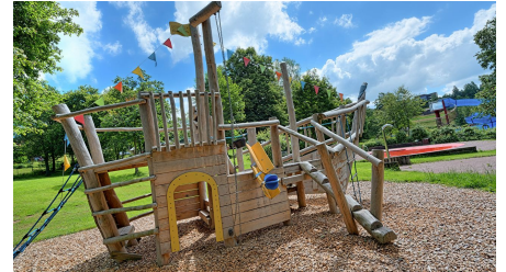
Freibad Lossburg Spielplatz Piratenschiff