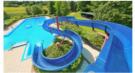
Freibad Lossburg Wasserrutsche