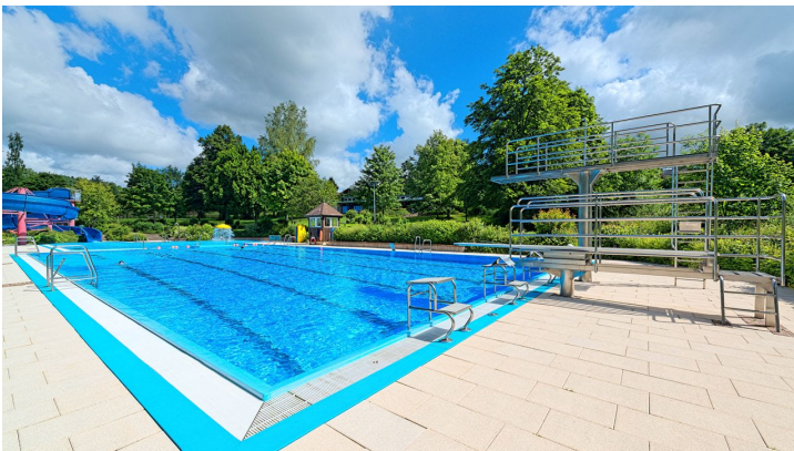
Freibad Lossburg Pool Gesamtansicht