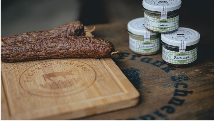
Frank Schneider_Tradition_Wurst_web.jpg