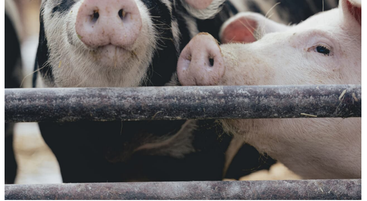
Frank Schneider_Tradition_Schweine.jpg - © TRANSMEDIAL www.transmedial.de