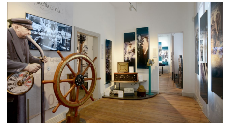
Elbschiffahrtsmuseum_Arbeiten an Bord