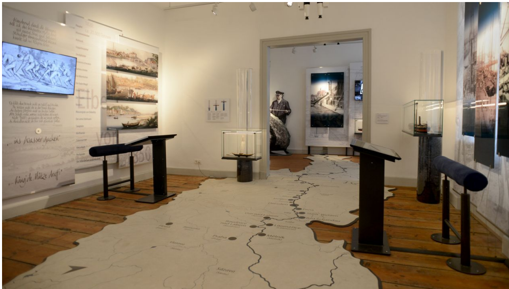
Interaktive Ausstellung Elbschiffahrtsmuseum

Freitag, 26.07.2024, 10:00 - 18:00 Uhr Samstag, 27.07.2024, 10:00 - 17:00 Uhr Sonntag, 28.07.2024, 10:00 - 17:00 Uhr Dienstag, 30.07.2024, 10:00 - 18:00 Uhr Mittwoch, 31.07.2024, 10:00 - 18:00 Uhr Donnerstag, 01.08.2024, 10:00 - 18:00 Uhr Freitag, 02.08.2024, 10:00 - 18:00 Uhr Samstag, 03.08.2024, 10:00 - 17:00 Uhr Sonntag, 04.08.2024, 10:00 - 17:00 Uhr Dienstag, 06.08.2024, 10:00 - 18:00 Uhr Mittwoch, 07.08.2024, 10:00 - 18:00 Uhr Donnerstag, 08.08.2024, 10:00 - 18:00 Uhr Freitag, 09.08.2024, 10:00 - 18:00 Uhr Samstag, 10.08.2024, 10:00 - 17:00 Uhr Sonntag, 11.08.2024, 10:00 - 17:00 Uhr Dienstag, 13.08.2024, 10:00 - 18:00 Uhr [...]