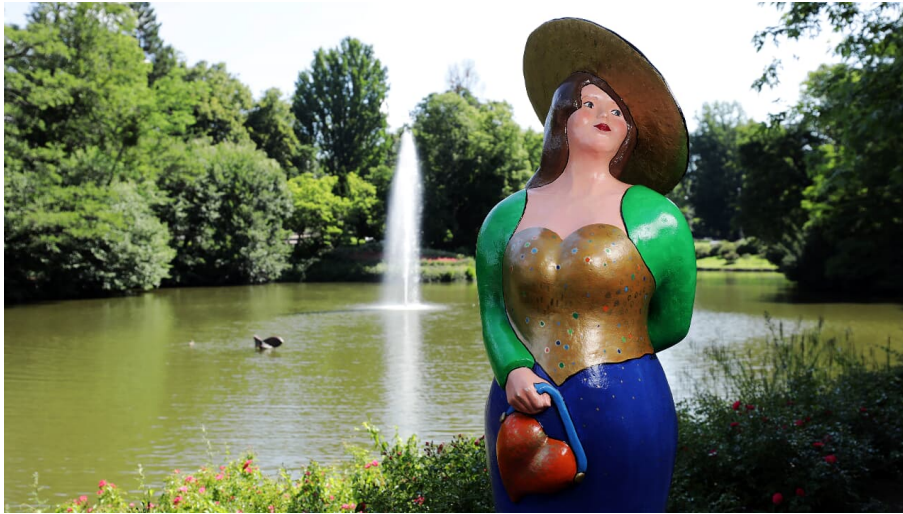
Bella - © Heiko Rhode