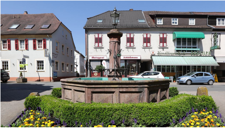
Bad König - Stadtmittelbrunnen