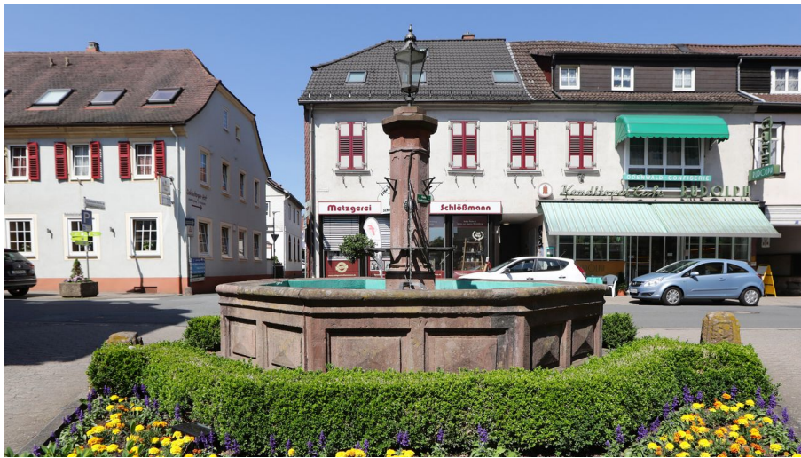
Bad König - Stadtmittelbrunnen