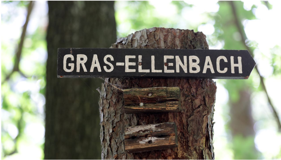
015HR - Grasellenbach - Wegezeichen.JPG