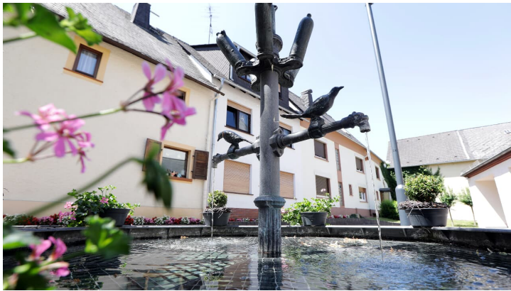
094HR - Bad Camberg - Stadtmitte.JPG