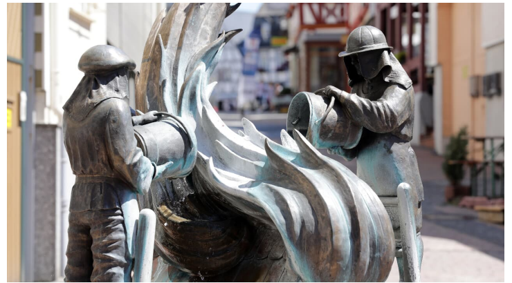
060HR - Bad Camberg - Stadtmitte.JPG