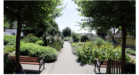
089HR - Bad Camberg - Kneipp-Kräutergarten.JPG