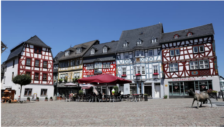
061HR - Bad Camberg - Stadtmitte.JPG