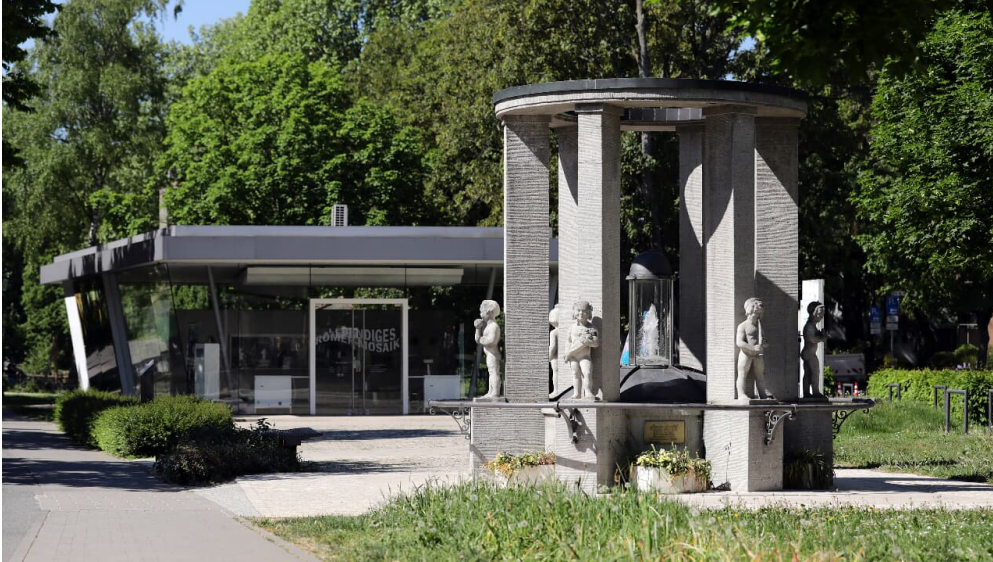
033HR - Bad Vilbel - Sprudel.JPG