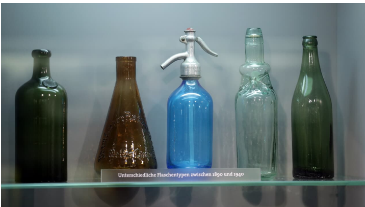
176HR - Bad Vilbel - Brunnen- und Bädereuseum.JPG