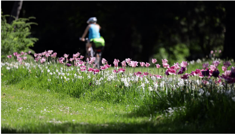
054HR - Bad Vilbel - Kurpark.JPG