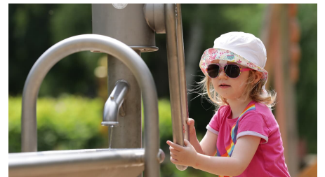
186HR - Bad Vilbel - Spielplatz.JPG