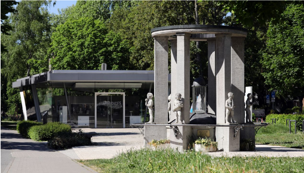
033HR - Bad Vilbel - Sprudel.JPG

ID: p_100109462 Zuletzt geändert am 20.09.2022, 12:27