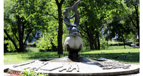
046HR - Bad Vilbel - Kurpark.JPG