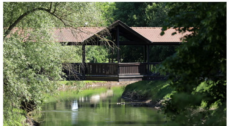
038HR - Bad Vilbel - Kurpark.JPG