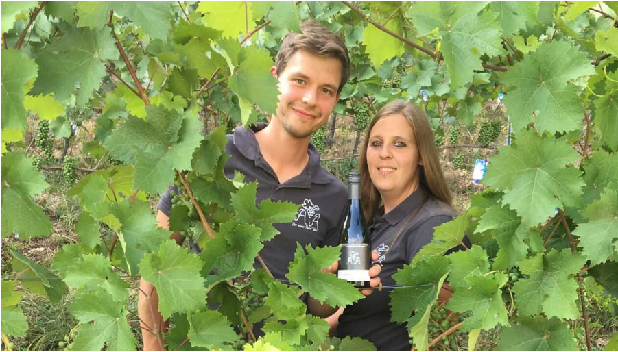
Weinhaus Altenburg Andrae GbR.jpg