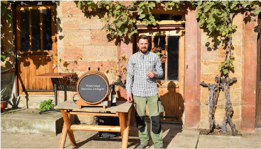
Weinhaus Marius Seeliger.jpg