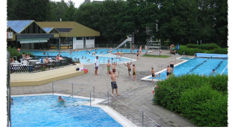
Erholungsbad Bad Camberg