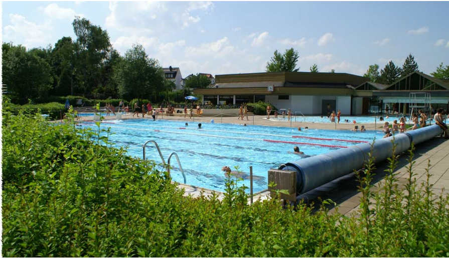
Erholungsbad Bad Camberg