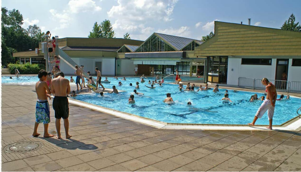
Erholungsbad Bad Camberg