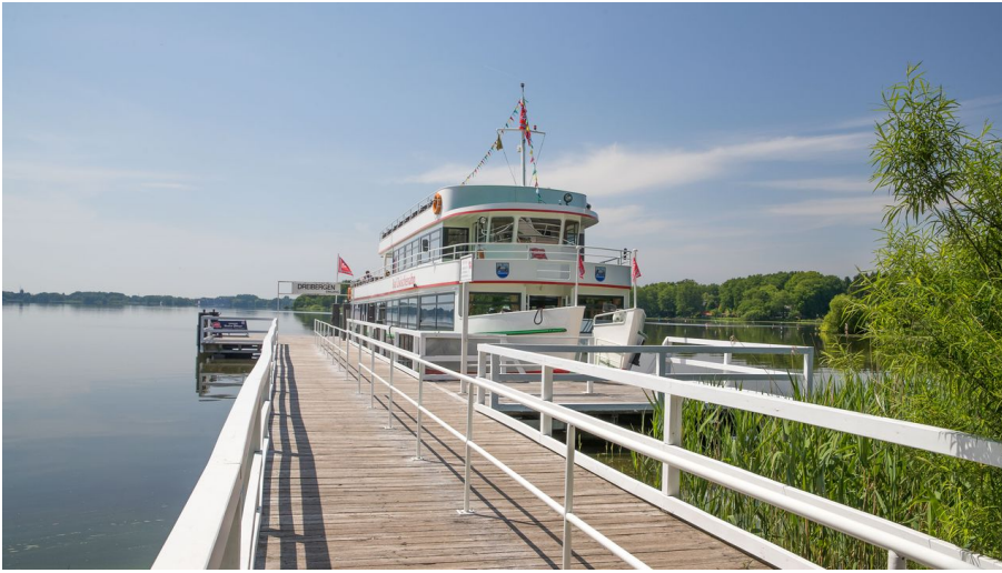
anleger-dreibergen