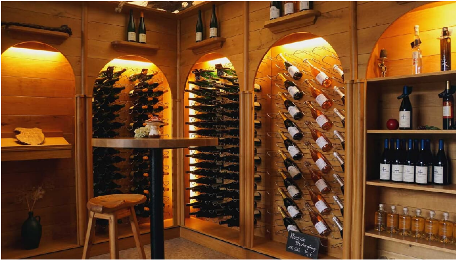
Weingut Hoffmann Alte Schrotmu#hle.jpg