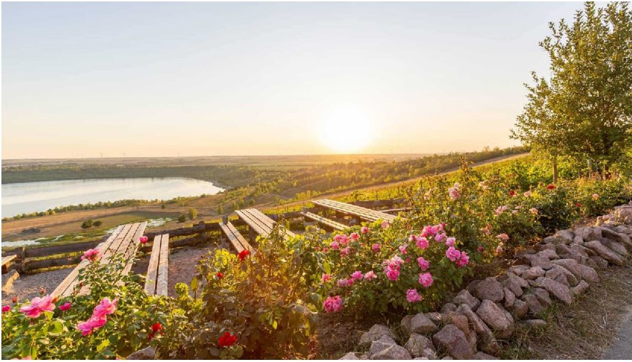
Weinbau am Geiseltalsee1.jpg