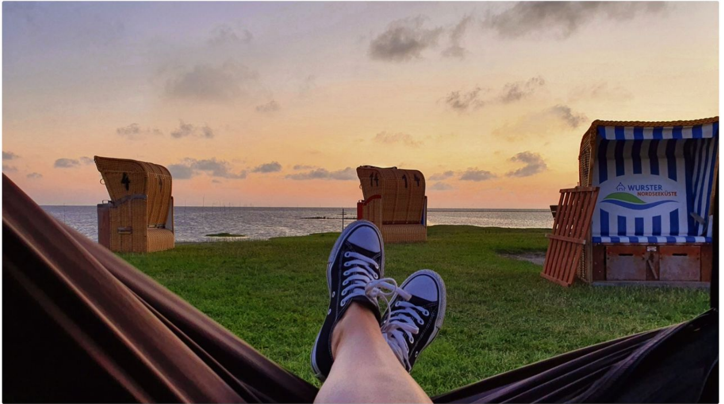
Bild Hängematte Leuschner.jpg

ID: p_100114880 Zuletzt geändert am 19.10.2023, 12:07