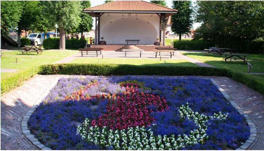
Kurgarten in Horumersiel