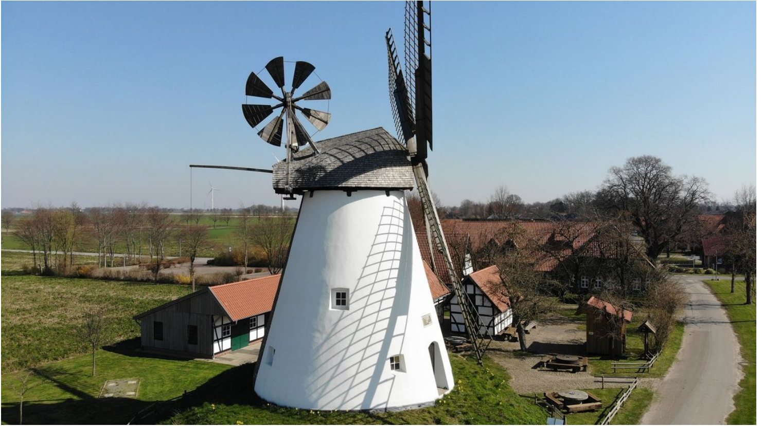
created by dji camera

ID: p_100115638 Zuletzt geändert am 01.02.2022, 16:24